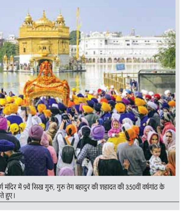
अमृतसर। सोमवार को अमृतसर के स्वर्ण मंदिर में 9वें सिख गुरु, गुरु तेग बहादुर की शहादत की 350वीं वर्षगांठ के उपलक्ष्य में नगर कीर्तन जुलूस में भाग लेते हुए।