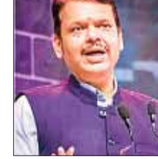
सीएम देवेंद्र फडणवीस और मुंबई शहर का ट्रैफिक

पूर्व-पश्चिम की कनेक्टिविटी सुधरेगी उन्होंने कहा कि इससे पूर्व-पश्चिम के बीच की कनेक्टिविटी सुधरेगी। बोरीवली और गोरेगांव के बीच समानांतर सड़क और अगले वर्ष तक तैयार होने वाला वर्ली-शिवाड़ी कनेक्टर अटल सेतु से बांद्रा-वर्ली सी लिंक तक बिना रुकावट की यात्रा सुनिश्चित करेगा। उअटल सेतु से गिरगांव चौपाटी तक ईस्टर्न एक्सप्रेस हाईवे के रास्ते में बनने वाली सुरंग तीन वर्षों में पूरी हो जाएगी।