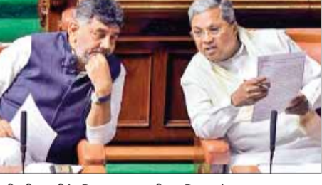
डिप्टी सीएम डीके शिवकुमार व सीएम सिद्धारमैया