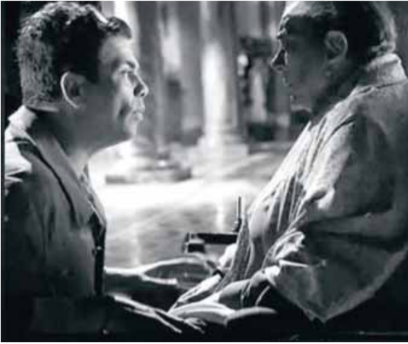
फिल्म 'रॉकी रानी की प्रेम कहानी' के एक दृश्य में करण जौहर और धर्मेन्द्र

फिल्म निर्माता करण जौहर ने धर्मेन्द्र को दो साल पहले उनकी फिल्म 'रॉकी रानी की प्रेम कहानी' में डायरेक्ट किया था, उन्होंने एक्टर की मौत को एक युग का अंत बताया है। अपने इंस्टाग्राम पर करण ने लिखा कि ये एक युग का अंत है। एक विशाल मेगा स्टार। मेनस्ट्रीम सिनेमा में एक हीरो का अवतार। हर रूप से सुंदर और सबसे रहस्यमय स्क्रीन प्रेजेंस। वो हमेशा भारतीय सिनेमा के एक लिविंग लीजेंड रहेंगे। सिनेमा के इतिहास के पन्नों में परिभाषित और समृद्ध रूप से मौजूद। लेकिन सबसे बढ़कर वो सबसे अच्छे इंसान थे। हमारी इंडस्ट्री में सभी उन्हें बहुत प्यार करते थे।