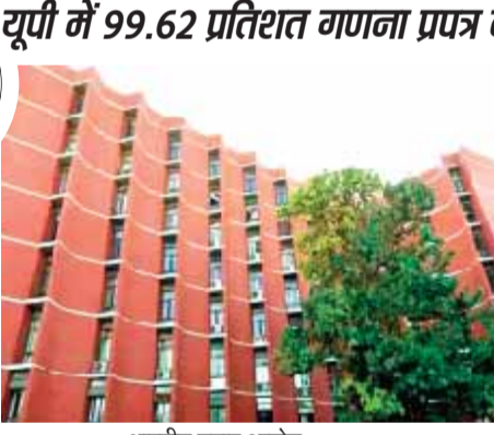
भारतीय चुनाव आयोग

गणना प्रपत्र का 100 प्रतिशत वितरण सबसे पहले गोवा और लक्षद्वीप में